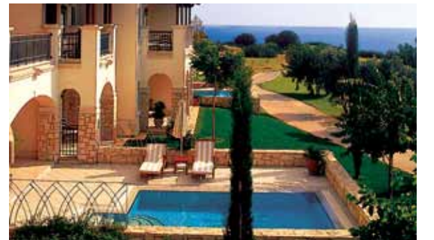
Ab nach Zypern: Die sechs besten Teams erwartet ein außergewöhnliches Turnierfinale im Aphrodite Hills Intercont Resort auf Zypern.