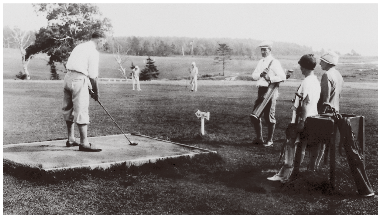
Ein Event mit langer Tradition: Die Business Challenge geht 2011 bereits ins 6. Jahr.